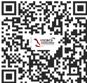
QR Recibido Auditoría Superior del Estado de Baja California Sur

INSTITUTO MUNICIPAL DE ASUNTOS INDÍGENAS Y AFROMEXICANOS DE LOS CABOS, BAJA CALIFORNIA SUR