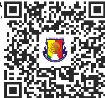
QR Recibido H. Congreso del Estado de Baja California Sur

Conforme a lo establecido en el convenio de colaboración institucional SIRET, cláusula 1.2, se informa que se recibieron un total de 76/87 = 87.35%